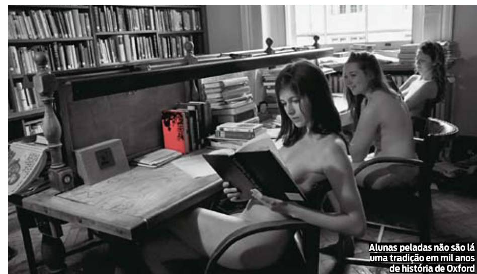
Alunas peladas não são lá uma tradição em mil anos de história de Oxford