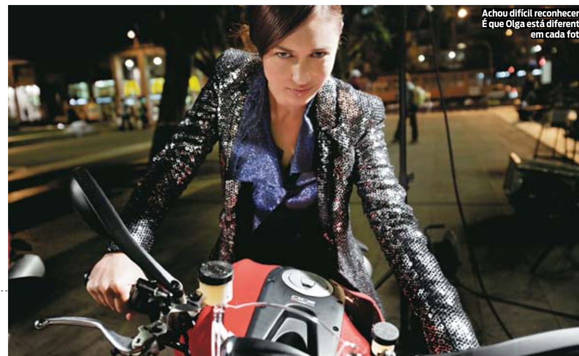
Achou difícil reconhecer? É que Olga está diferente em cada foto

Estudantes da tradicionalíssima Universidade de Oxford, na Inglaterra, tiraram a roupa para ajudar missões de caridade em nove países pobres. Segundo os organizadores, £ 3 de cada calendário vendido vão diretamente para os projetos. Cerca de 60 alunos posaram pelados em cenários corriqueiros do campus, como a biblioteca ou a sala de música. AVISO: infelizmente, nem todos os alunos são mulheres. Parte do calendário está contaminada com traseiros peludos. VIP recomenda que você pule alguns meses e tenha um ano mais curto. £ 10 (R$ 30,40) + frete, na www.oxfordcalendar.co.uk